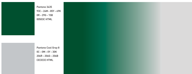
← Tavola cromatica

Le dimensioni possono essere ridotte fino a 17 mm. di altezza per il marchio versione verticale e fino a 8 mm. per quello versione orizzontale o ad alta leggibilità.